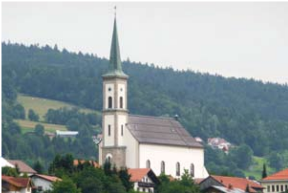
Die Steinkirche in Grainet lädt zu einer kulturellen Pause ein

Über den schönen Marktplatz von Waldkirchen führt der Goldene Steig auf der Siedlungsstraße nach Schiefweg mit seinem hübschen Säumerbrunnen. Von dort geht es auf dem Säumerweg den Hang hinauf. Oben hat man einen herrlichen Blick auf das Waldgebirge. In stetigem Auf und Ab mit schönen Ausblicken über die gegliederte Kulturlandschaft gelangt man über Höhenberg, Böhmzwiesel und den früheren Mautort Fürholz mit seinem Goldenen-Steig-Brunnen schließlich in die Säumer-Ortschaft Grainet mit seiner beeindruckenden Steinkirche auf dem Dorfanger.